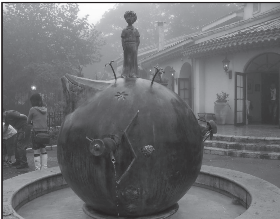
Asteroid des kleinen Prinzen in Japan