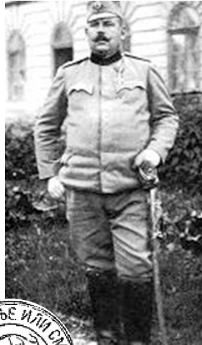
Das Attentat und der Mann fürs Grobe: Dragutin Dimitrijević, Oberhaupt der „Schwarzen Hand“ und Chef des serbischen Militärgeheimdienstes. Links unten: Tödlicher Mummenschanz, das Siegel der „Schwarzen Hand“

klar. Sie kannten auch einige der Namen, 8 und sie addierten zu diesen Personen als notwendigen Ermittlungsansatz eine ihnen zumindest dem Namen nach wohlbekannte Propaganda- und Terrororganisation, Narodna Odbrana (Volksschutz). 9 Das traf nicht zu hundert Prozent ins Schwarze, 10 denn es stand eine Geheimorganisation hinter dieser Geheimorganisation. Ihr Name lautete Ujedinjenje ili Smrt (Vereinigung oder Tod), 11 vulgo: die Schwarze Hand . Der Kopf dieser Bande hieß Dragutin Dimitrijević, 12 genannt Apis . 13 Er war im Hauptberuf der Chef des serbischen militärischen Geheimdienstes.