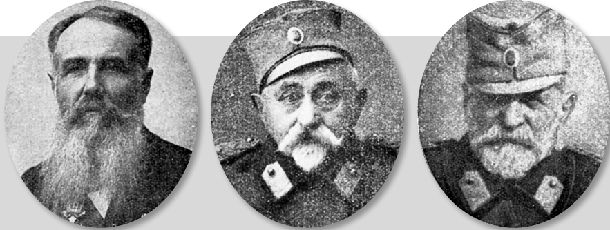
Die verantwortlichen Exekutoren der serbischen Gewaltpolitik: Ministerpräsident Nikola Pašić, Kriegsminister Stepa Stepanović, Generalstabschef Radomir Putnik

nisation der „Schwarzen Hand“. 46 Dessen Name war Milan Ciganović. 47 Dieser wurde den österreichischen Ermittlungsbehörden durch die Aussagen der Attentäter bereits nach wenigen Tagen bekannt und folglich im österreichischen Ultimatum namentlich als festzunehmen erwähnt. Doch