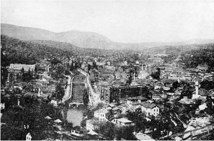
Sarajewo, Aufnahme von 1914. Das dunkle Gebäude in der Bildmitte ist das Rathaus, in dem der österreichische Thronfolger empfangen wurde. Dann fuhr er mit dem Auto den Appelkai, rechts des Miljačka-Flusses, entlang. An der letzten Brücke im Bildhintergrund fand das Attentat statt.

In der Zeit vor dem Ersten Weltkrieg, von der in diesem Buch die Rede ist, waren die Serben erst am Beginn ihrer Expansion. Im Ersten Balkan-