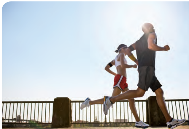
Neben Nordic Walking oder Radfahren ist Joggen die beliebteste Ausdauersportart.

Bei jeder einzelnen Bewegung verbrauchen unsere Muskelzellen Energie. Je muskulöser jemand ist, desto höher ist sein Energiebedarf während