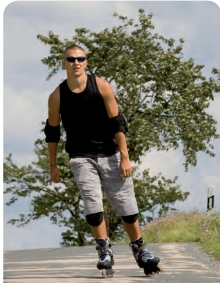
Inlineskaten macht nicht nur Spaß, sondern hält auch das Herz-Kreislauf-System in Schwung.

Aus diesem Grund wird völlig zu Recht dazu geraten, sich regelmäßig sportlich zu betätigen. Empfohlen werden meist jene Sportarten, die die Ausdauer verbessern, wie Laufen, Radfahren, Inlineskaten oder Schwimmen. Ein