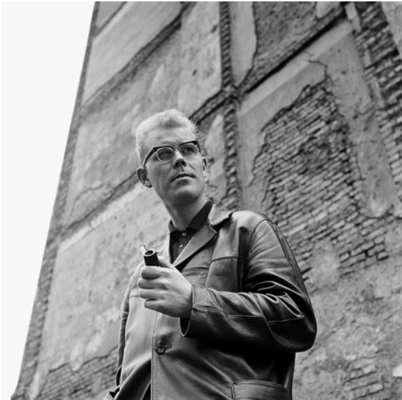
Die Fotos wurden von Digne Meller Marcovicz in dieser Anordnung zusammengestellt für ihr Buch »... die Lebendigen und die Toten ...«.