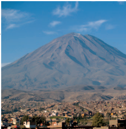
Der Vulkan Misti bei Arequipa