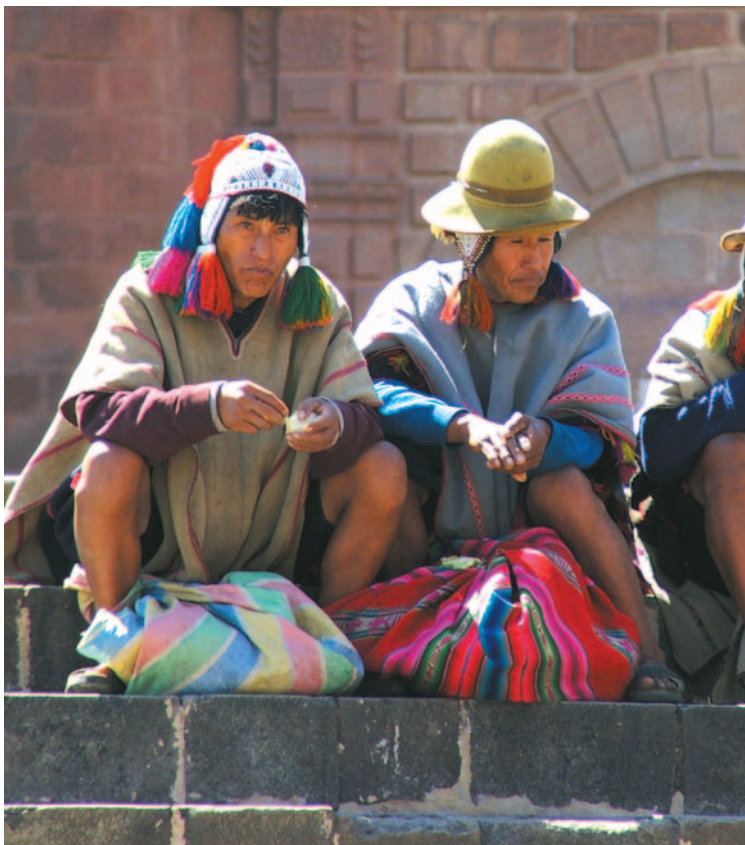
Ureinwohner auf den Treppenstufen von Cusco