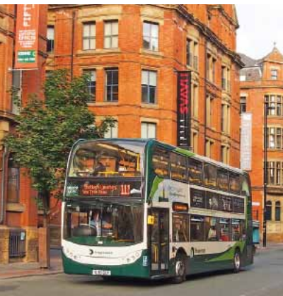
004ma Abb.: ar

unmittelbare Nähe zum Bahnhof und zu Straßenbahn- und Busverkehrsknotenpunkten machen ihn zu einem beliebten Treffpunkt. Nördlich an den Platz schließt das lebendige Northern Quarter 32 an, das mit seinen vielen Cafés und kleinen Läden zum Bummeln einlädt und abends dank seiner Musikkneipen und Klubs viele Nachtschwärmer anlockt. Südlich hiervon liegen Chinatown 29 und das Gay Village (s.S.43), wo es an Wochenenden laut und lustig zugeht. Die Museen rund um die Oxford Road liegen zum Teil mehr als 1km vom Zentrum entfernt, aber die Straße gehört zu den dichtbefahrensten Busrouten Europas, weshalb man selten länger als einige Minuten auf den nächsten Doppeldecker warten muss. Wer die hypermodernen Salford Quays (s.S.48) mit der BBC-Zentrale und mehreren Museen von Weltklasse erkunden will, nimmt dafür am besten die Straßenbahn Metrolink bis zur Harbour City oder einen Stopp weiter bis zur MediaCityUK. Das gleiche gilt für das Stadion Old Trafford 39 und besuchenswerte Vororte wie Chorlton 42 : Sie sind alle innerhalb von rund 15 Minuten mit der Metrolink zu erreichen. Chorlton lockt nicht nur mit seinen gemütlichen Pubs und Cafés, in denen es etwas gemächlicher zugeht als in der Innenstadt, es gibt Besuchern auch einen guten Einblick in das Alltagsleben abseits des Zentrums.