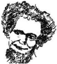
Abb. 1.4 |

Georges Perec: La vie mode d'emploi (1978), Première partie, chap. 20 (Auszug)