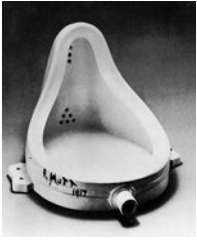
Abb. 1.5 |