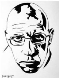
Abb. 1.6 |