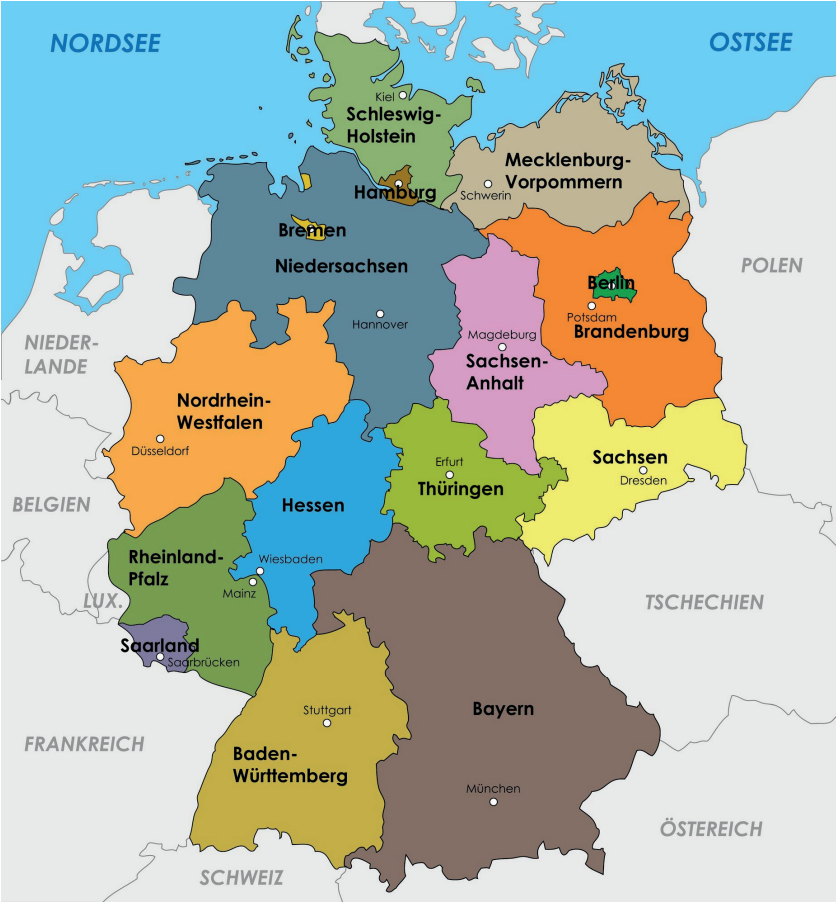
Abb. 2: Bundesländer Deutschlands