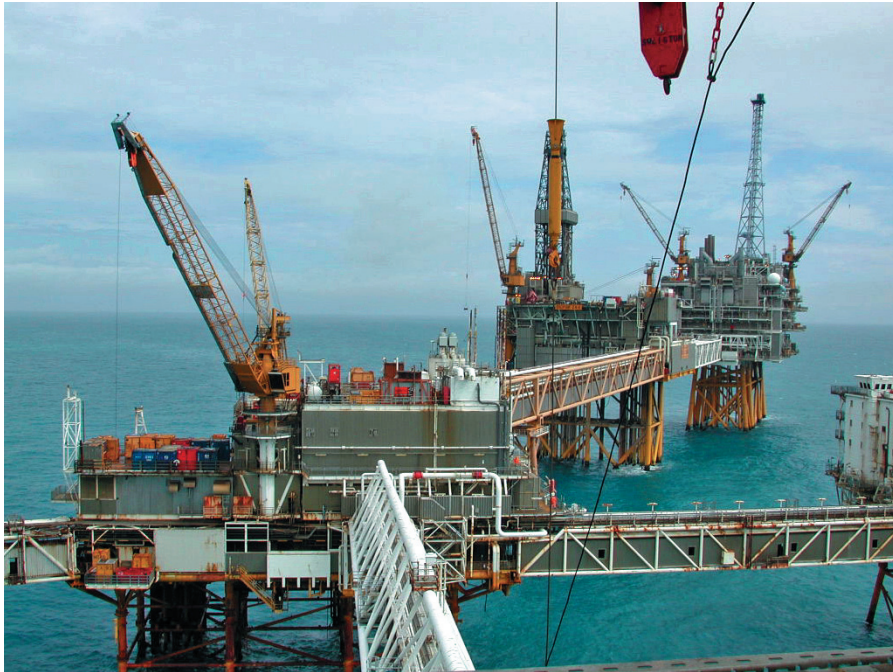
Abb. 1.1: Es wird immer aufwendiger und teurer, das stetig knapper werdende Erdöl zu fördern. Sobald irgendwo ein Hurrikan im Anzug ist, schnellt der Ölpreis in die Höhe, da mit Produktionsausfällen gerechnet wird.

Die Internationale Energie Agentur (IEA) rechnet damit, dass die weltweiten Ölreserven derzeit jedes Jahr um 6,7 % sinken. Gleichzeitig schätzt sie, dass im Jahr 2030 die Nachfrage um 37 % höher sein wird als 2006, dem Jahr, in dem die Ölförderung vermutlich ihren Höhepunkt überschritten hat und nicht mehr steigerbar ist. Eine Analyse der Energy Watch Group aus dem Jahr 2007 ist zu dem Ergebnis gekommen, dass die Ölförderung sehr schnell zurückgehen wird und etwa bis zum Jahr 2030 nur noch die Hälfte des heutigen Werts erreichen wird (weitere Informationen finden Sie auf den Internetportalen www.energywatchgroup.org und www.aspo-deutschland.org ).