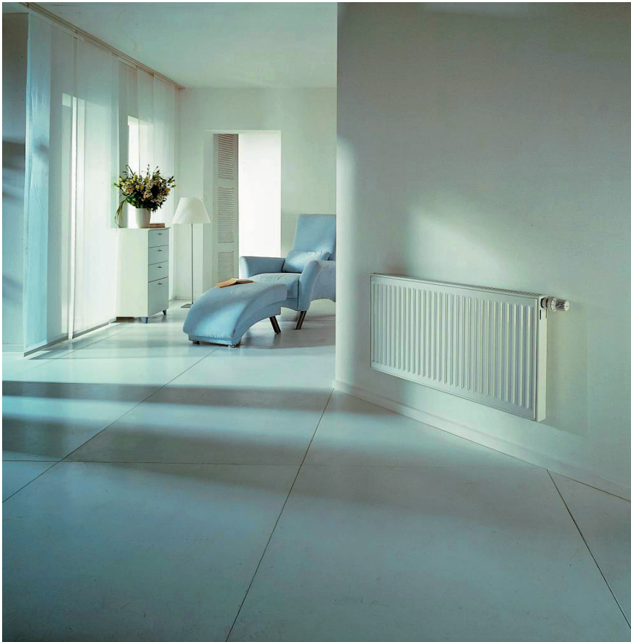
Abb. 1.4: Moderner Flachheizkörper