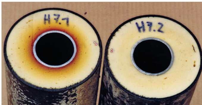
Abb. 1.2: Ein Fernwärmerohr mit einer Dämmung aus Polyurethan-Schaumstoff nach 16 Jahren im Einsatz: Beim heißen Vorlaufrohr (links) zeigt sich die erste Verfärbung. Im Lauf der Zeit gelangen Sauerstoff und Stickstoff aus der Luft in die Schaumstoffblasen, gleichzeitig entweicht Kohlendioxid. Dadurch verschlechtern sich die Dämmeigenschaften.

Aus welchem Material bestehen die Rohrleitungen und wie verlaufen sie? Sind sie auch ausreichend gedämmt? Wenn die Heizung im Keller steht, lässt sich die Verteilung im Regelfall anhand offen verlegter Leitungen leicht verfolgen und im Kellergrundriss festhalten. Bei Systemen mit oberer oder Stockwerksverteilung ist es unter Umständen schwieriger, die Leitungsführung zu ermitteln. Es gibt ältere Anlagen, die ein offenes Ausdehnungsgefäß an der höchsten Stelle haben – meist auf dem Dachboden. Bei diesen werden alle Steigstränge und oft auch der Kesselstrang zur Entlüftung zu diesem Behälter geführt. Heute sind geschlossene Anlagen üblich, bei denen es praktisch keinen Wasserverlust und selten Korrosionsprobleme gibt.