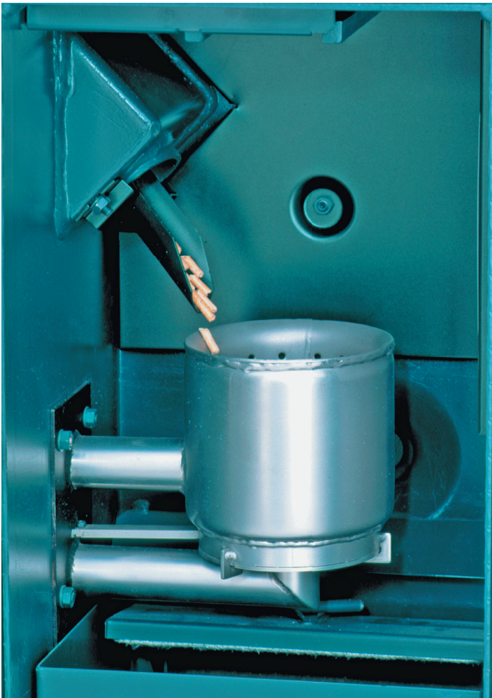
Abb. 1.6: Edelstahl-Brennkammer für Pellets.

Eine nachhaltige Nutzung vorausgesetzt, sind erneuerbare Energieträger wie Holz, Pellets und Pflanzenöl theoretisch beliebig lange verfügbar. Sie werden wahrscheinlich sogar direkt in Ihrer Region produziert.