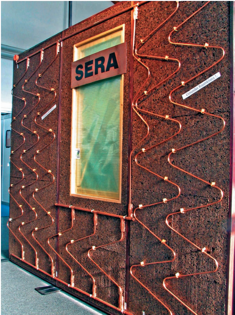
Abb. 1.5: Vorgefertigtes Wandelement mit Leitungen für eine Wandheizung

lungsanteil für eine ausgeglichene, behagliche Temperaturverteilung im Raum sorgt. Sie ist auch wesentlich einfacher nachträglich einzubauen als eine Fußbodenheizung. Wandheizungen erhöhen die Wandtemperatur. An schlecht oder zu gering gedämmten Außenwänden ist mit erhöhtem Wärmeverlust zu rechnen. Deshalb sollte man die Innenwände dafür bevorzugen.