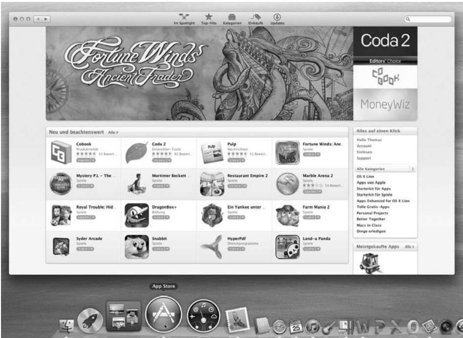
Bild 1.5: Apps und einen App Store gibt es jetzt auch für jeden Mac.

Apple hat das App-Grundprinzip bereits auf seine aktuelle Mac-Betriebssystemversion OS X übertragen und auch dort einen App Store integriert. Von jedem Mac (Mac Mini, iMac oder MacBook) aus, der mit einer aktuellen OS X-Version ausgestattet ist, haben Sie über den App Store Zugriff auf Abertausende von Mac-Programmen.