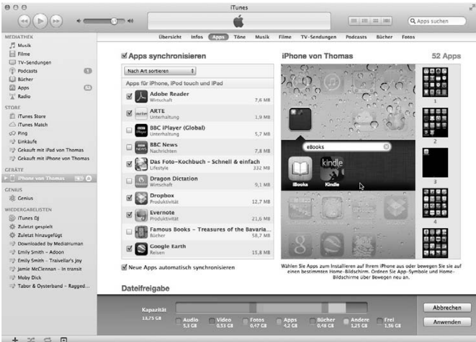
Bild 1.8: Im App-Bereich verwalten Sie die vorhandenen Apps und bestimmen die App-Belegung Ihres iPhones.

Über die Auswahl­schalt­flächen der oberen Navigations­leiste öffnen Sie die verschiedenen Inhalts­bereiche ( Infos, Apps, Töne, Musik etc.) und können z. B. die Musik-, Video- und Fotoauswahl bestimmen, mit der Sie Ihr iPhone bestücken möchten. Klicken Sie in der Leiste auf die Schalt­fläche Apps , öffnet sich der App-Verwaltungs­bereich, in dem Sie z. B. festlegen, welche der bereits vorhandenen Apps auf Ihrem iPhone installiert oder entfernt werden sollen. In der Home­bildschirm-Vorschau können Sie außerdem die App-Symbole sehr einfach mit der Maus neu anordnen und in Ordnern zusammen­fassen.