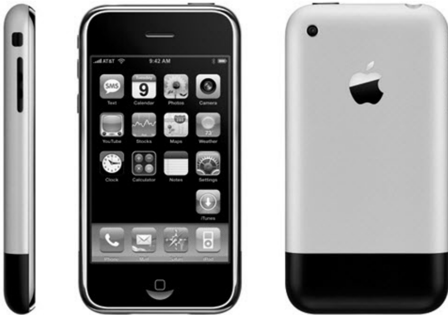
Bild 1.4: Als 2007 das erste iPhone veröffentlicht wurde, gab es dafür bereits 2.000 Apps.

Wie erfolgreich die Apple-Strategie war, zeigt die Tatsache, dass bereits bei Erscheinen des ersten iPhones Ende Juni 2007 2.000 Apps im App Store von iTunes zur Verfügung standen und es kaum einen Monat dauerte, bis die Zehntausendermarke erreicht war. Jetzt, gut fünf Jahre später, sollen es bereits mehr als 450.000 Apps sein, die im App Store angeboten werden.