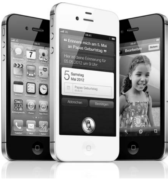
Bild 1.1: iPhone 4S, das bisher beste iPhone, das es je gab. (Foto: Apple)

Ihr iPhone ist nicht nur einfach ein Mobiltelefon mit Internetanbindung, sondern eine Vertriebsplattform für Musik- und Videodateien und vor allem für Programmanwendungen – den Apps, um die es in diesem Buch geht. Musik, Videos und Apps können nur über das Internetverkaufsportale iTunes oder den internen App Store auf Ihr iPhone gelangen. Nach einem kurzen Streifzug durch die iPhone-Geschichte erfahren Sie in diesem Kapitel, wie Sie Apps aus dem App Store und über iTunes laden, wie Sie iTunes auf einem Windows-PC einrichten und wie Sie die QR-Code-App auf Ihr iPhone bekommen, mit der Sie die QR-Codes anpeilen und entschlüsseln können, die bei den App-Einzelvorstellungen in diesem Buch abgedruckt sind.