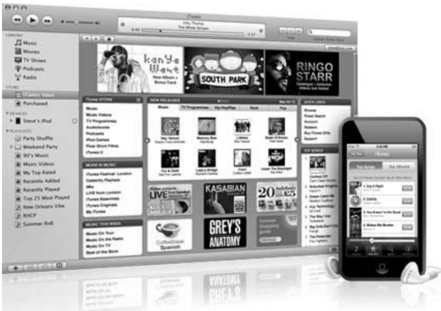
Bild 1.3: Durch iTunes konnte das iPhone von Anfang an als Vertriebsplattform genutzt werden.

Apple hat es vorgemacht: Mit dem Erscheinen des ersten iPhones und dessen obligatorischer Anbindung an das Internetverkaufsportale iTunes wurde ein Endgerät erstmals konsequent als Vertriebsplattform genutzt. Musik, Videos und vor allem Apps konnten und können nur über iTunes oder den internen App Store auf ein iPhone oder neuerdings auch auf ein iPad übertragen werden. Zur Registrierung eines iPhones oder iPads bei der Erstinbetriebnahme gehört daher folgerichtig auch gleich die Angabe einer Kreditkartenverbindung.