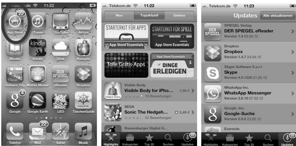
Bild 1.6: Mit der App Store-App verbinden Sie Ihr iPhone direkt mit dem App Store.

Die App Store-App ist Ihre Direktverbindung zum App Store. Wenn Sie die App Store-App über den Homebildschirm Ihres iPhones starten, können Sie sich im App Store über neue Apps informieren, sich die beliebtesten kostenpflichtigen und kostenlosen Apps anzeigen lassen, gezielt nach bestimmten Apps suchen und bereits vorhandene Apps aktualisieren. Die Zahlenangabe im App-Symbol weist Sie übrigens auf die Anzahl der vorhandenen Updates hin.