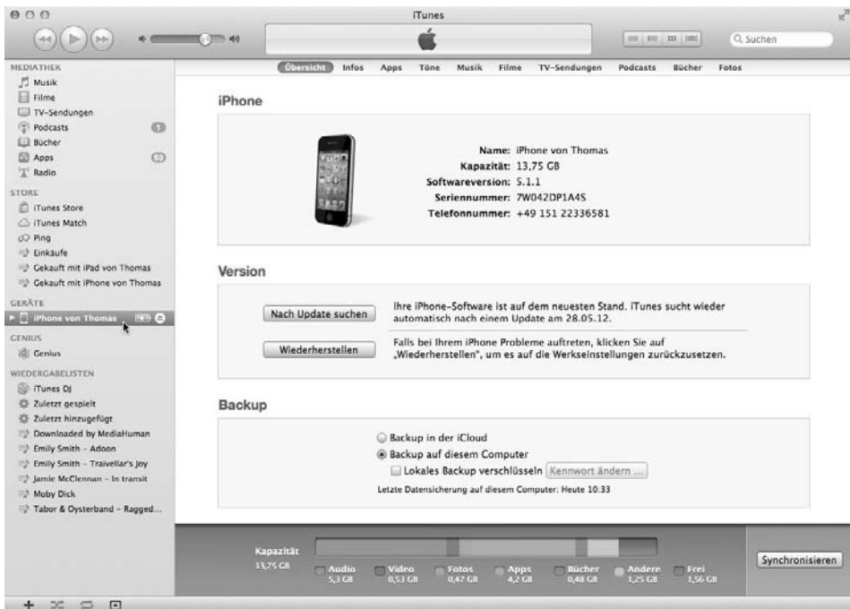
Bild 1.7: iTunes zeigt Ihnen den Verwaltungsbereich, wenn Sie in der Navigationsleiste auf den Geräteeintrag Ihres iPhones klicken.

Mit einem Klick auf den Geräteeintrag Ihres iPhones in der Navigationsleiste von iTunes öffnen Sie den Verwaltungsbereich.