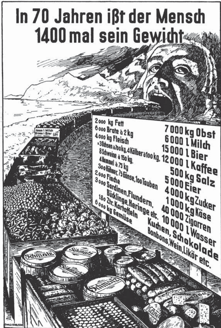
Extrembeispiel aus einem Diätatgeber des Jahres 1902