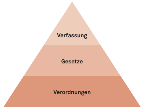
Abbildung 2: Gesetzesrecht.

Das geschriebene Recht (nur das Gewohnheits- und Richterrecht sind nicht geschrieben) nennt man auch positives oder gesetztes Recht. Es beginnt zu wirken, wenn es in einer amtlichen Publikation veröffentlicht wurde. Dabei ist es unerheblich, ob der einzelne Bürger oder die einzelne Bürgerin das Recht auch tatsächlich kennt.