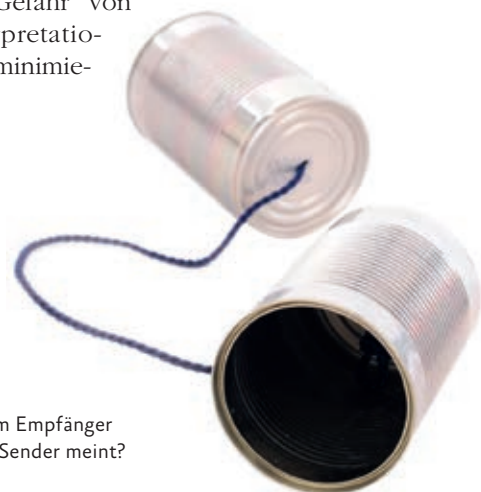
Kommt beim Empfänger an, was der Sender meint?

Auftrag an die Gesprächspartner ist also, sich auf eine „gemeinsame Sprache“ zu verständigen. Insbesondere aktives Zuhören, intensives Nachfragen und ein permanentes Feedback tragen dazu bei, den gemeinsamen Speicher an Zeichen laufend anzufüllen und so die Gefahr von Fehlinterpretationen zu minimieren.