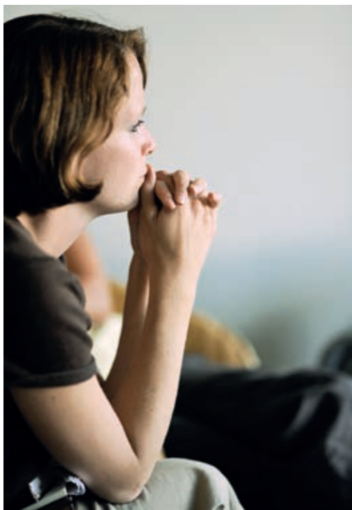
Richtiges Zuhören will gelernt sein

keit. Reden können wir alle, aber das heißt noch nicht, dass wir auch erfolgreich kommunizieren können. Das Erlangen von wirklicher Kommunikationsfähigkeit erfordert sozusagen lebenslanges Lernen. Und eine gelingende Kommunikation ist erforderlich, damit Verständigung, Kooperation, Weiterentwicklung und Wachstum möglich werden. Ebenso erforderlich ist die Fähigkeit des Zuhörens.