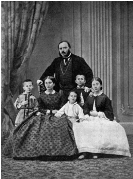
1 Die Familie Della Chiesa (ganz links Giacomo, der spätere Papst)

Der spätere Papst wurde unter dem Namen Giacomo Giovanni Battista Della Chiesa am 21. November 1854 geboren. 1 Er stammte aus einer sehr alten Familie von Markgrafen, die ursprünglich aus Savona kam und schon seit dem späten 13. Jahrhundert in Genua nachweisbar ist. Die Familie zählte seit Jahrhunderten zum alten Stadtpatriziat der großen Seefahrerstadt am Mittelmeer und konnte bereits im 16. Jahrhundert Flottenadmiräle und Senatoren vorweisen. 2 Der Franziskaner Bernardino Della Chiesa (1644–1721), der im frühen 18. Jahrhundert der erste Bischof von Peking gewesen war, nachdem er zuvor dem römischen Mu-