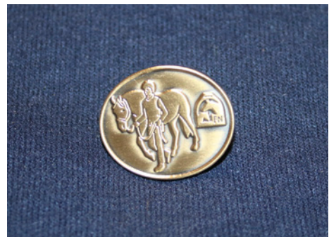
Die Anstecknadel: Abzeichen Bodenarbeit

Nach abgeschlossenem Lehrgang wird das Zertifikat „Bodenarbeit Weiterbildungskurs“ durch den Ausbildungsleiter im Auftrag der FN ausgehändigt.