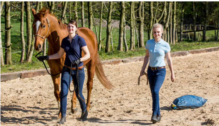
Das Führen mit HelferIn, die einen Klappersack hinterherzieht, ist eine Gelassenheitsübung.

Er muss den individuellen Bereich des Pferdes anerkennen und akzeptieren und dann dem Pferd mit klaren Regeln verständlich machen,