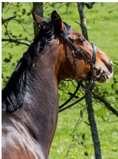
Die Stute mit deutlicher Spannung, hoher Hals- haltung und Misstrauen, was hinter ihr passiert

merksam zu sein. Sie gehören nur in die Hand von erfahrenen Pferdemenschen. Auch sehr „brave“ Hengste müssen sehr sicher geführt werden.