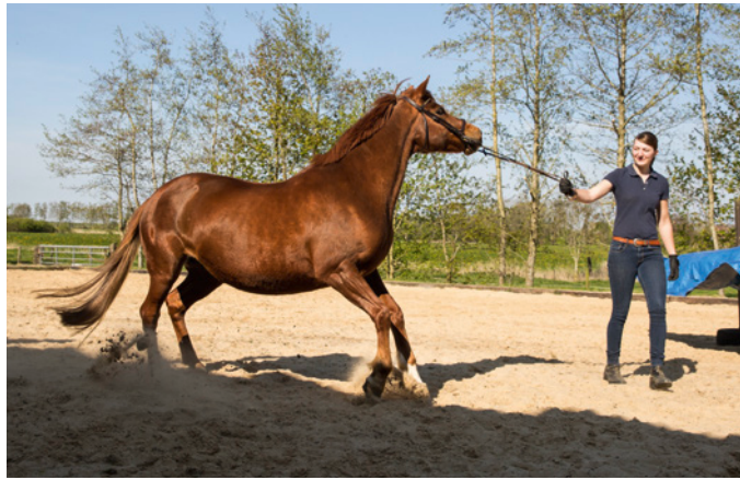
Erschrecken und Wegspringen vor der wehenden Plane