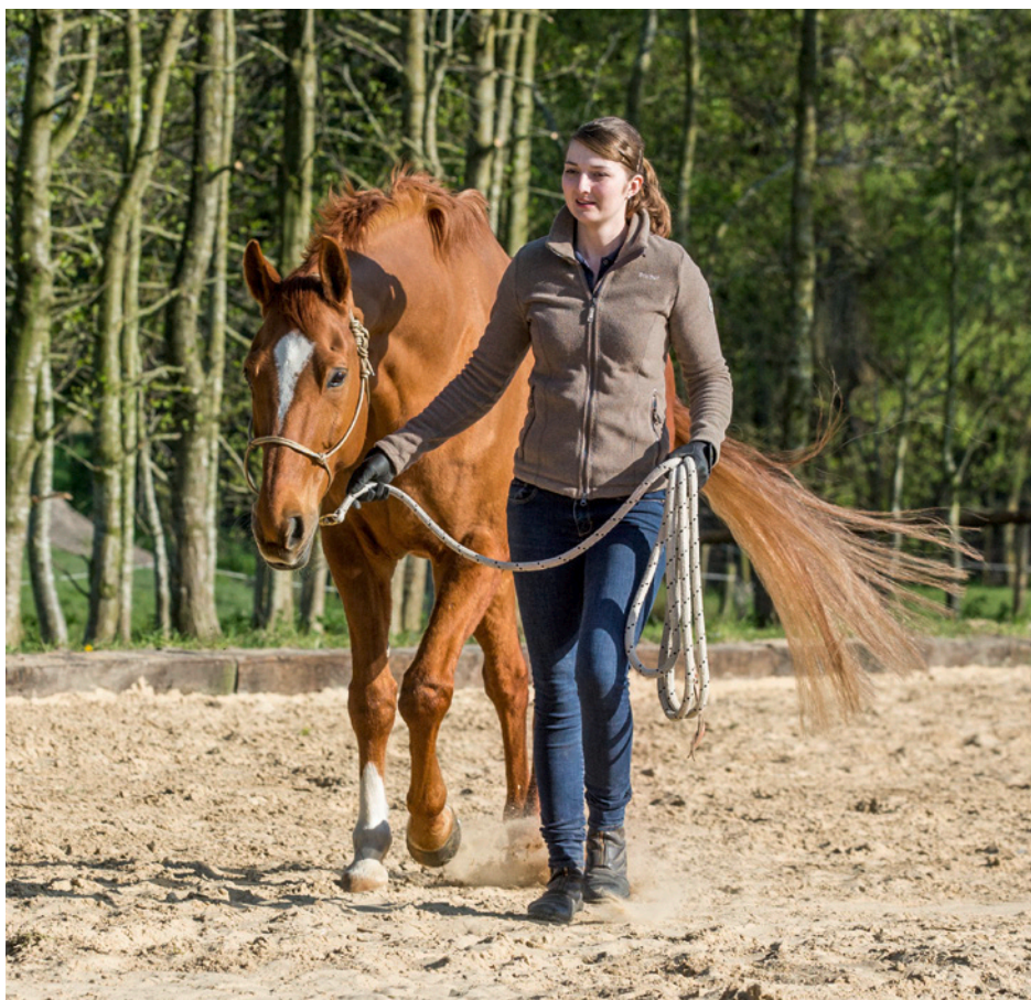
Das gehört zur Stationsprüfung: Hinführung zur Grußaufstellung.

Die Durchführung des Lehrgangs muss mindestens durch einen Trainer-C mit gültiger DOSB- oder BLSV-Trainerlizenz mit der Ergänzungsqualifikation Bodenarbeit – bzw.