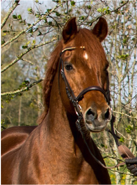
Pony mit deutlicher Anspannung und weit offenen Nüstern, kurz vor der „Flucht“

Flucht an, obwohl es sich für uns nur um ganz normale Umweltsituationen handelt. Um diesem Instinktverhalten vorzubeugen, bedarf es einer sehr guten, auf Vertrauen ausgerichteten Ausbildung des Pferdes. Als Mensch muss ich die verschiedenen Pferdetypen kennen, denn auch bei den vermeintlich sehr ruhigen Rassen ist dieser Fluchtinstinkt vorhanden, gehört zum „normalen Pferdeverhalten“ und darf auf keinen Fall durch Strafen geahndet werden, das würde durch den Vertrauensverlust des Pferdes die Fluchtreaktionen in Zukunft noch verstärken.