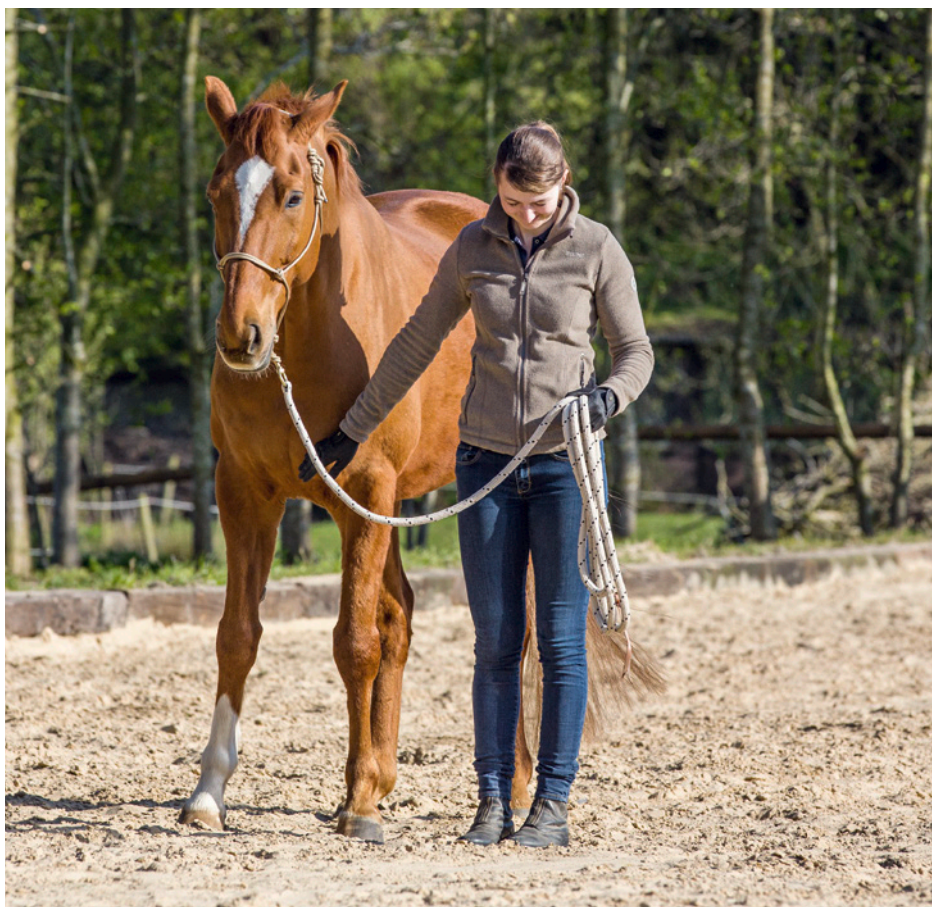
Rechter Arm und Kopf werden zum Grüßen kurz gesenkt.