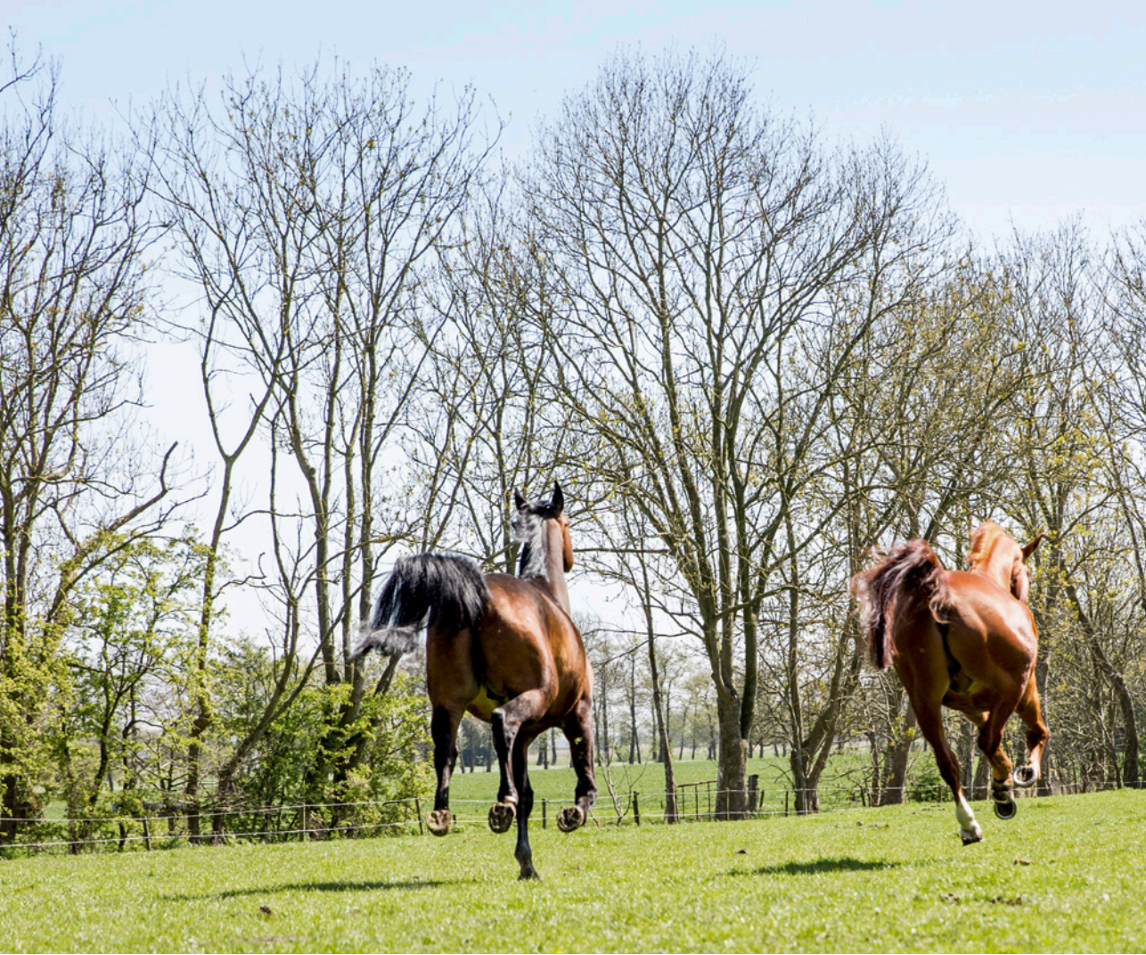
Spontanes Flüchten im Galopp auf der Weide