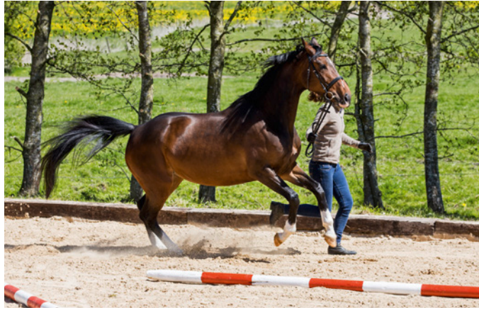
Deutliche Spannung beim Traben an der Hand