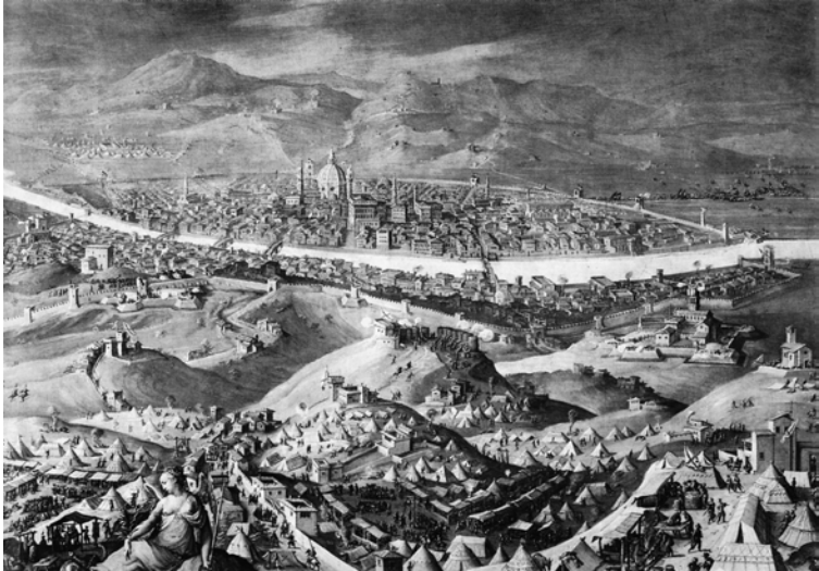
Florenz liebte Machiavelli mehr als seine Seele: Vasaris Fresko zeigt die Stadt am Arno in einem ihrer dramatischsten Momente, bei der Belagerung durch ein spanisches Heer im Sommer 1530.

hen, in denen er sich über seine Familie und seinen Werdegang äußert. Doch auch solche Dokumente sind rar. In Florenz, einer Stadt mit weniger als 50 000 Einwohnern, kannte man sich; einen geschriebenen Lebenslauf musste niemand bei der Bewerbung um ein Amt vorlegen.