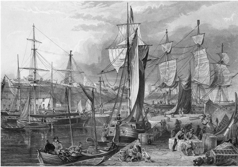
Abb. 1: Der Hafen von Kirkcaldy. Kupferstich von Joseph Swan, um 1840

von Gedanken und oft genug als Versuch gedeutet werden, andere von der Qualität einer bestimmten Sache zu überzeugen.