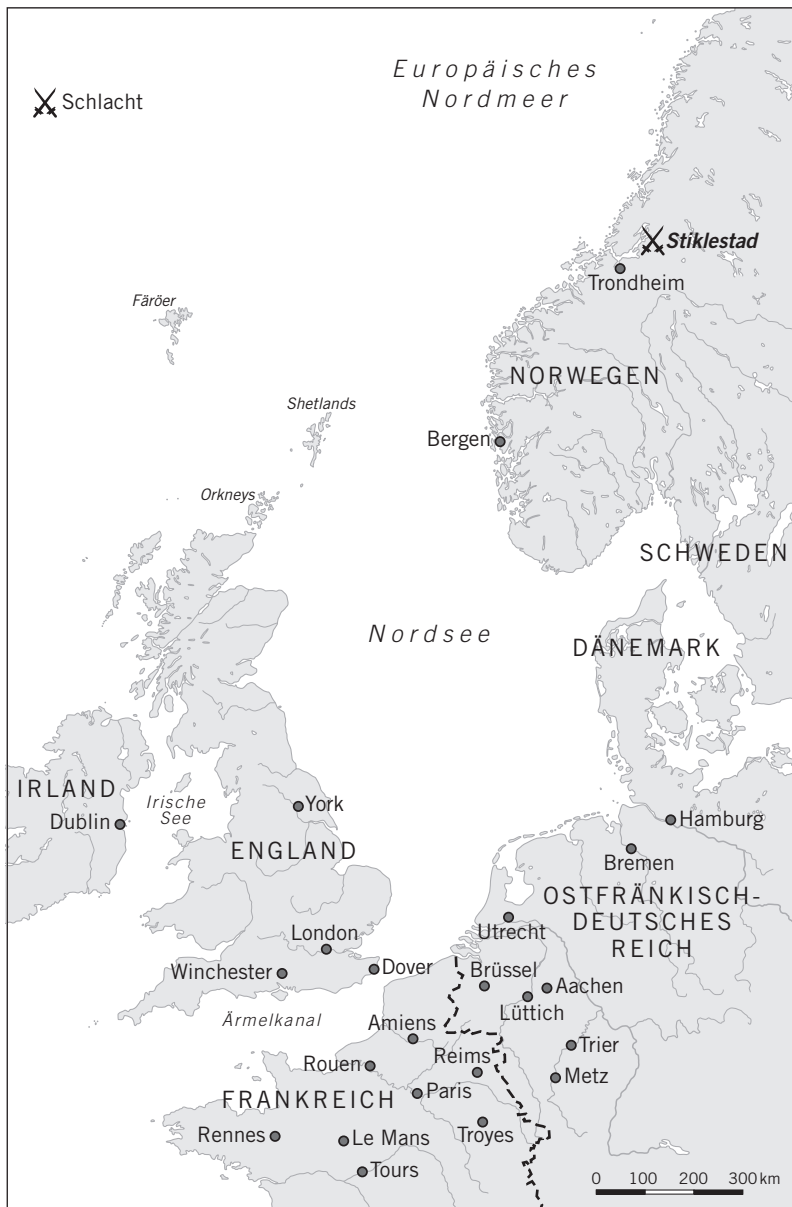
Karte 1 Der Nordseeraum