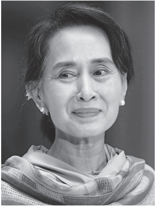
Aung San Suu Kyi – für viele eine Lichtgestalt. Die Asiatin verkörpert Hoffnung für Millionen.

Reihe mit dem Südafrikaner Nelson Mandela und dem Dalai Lama, dem religiösen Oberhaupt der Tibeter. Wer von ihr spricht, denkt an den amerikanischen Prediger Martin Luther King oder den tschechischen Dissidenten und späteren Präsidenten Václav Havel.