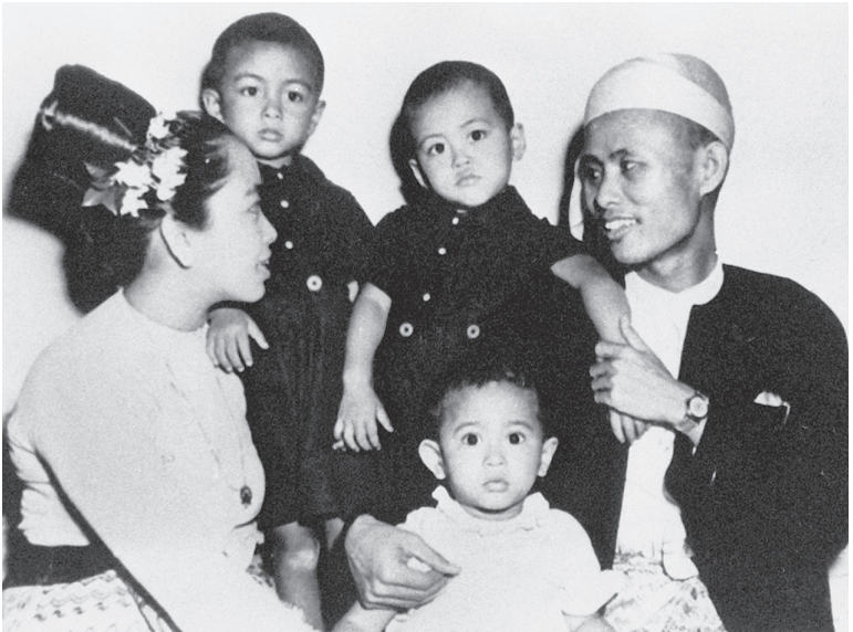
Familienglück in Rangun 1947: Aung San Suu Kyi (im Vordergrund) mit Mutter Khin Kyi, den Brüdern Aung San Oo und Aung San Lin und ihrem Vater Aung San

In der Stadt Pyapon wimmelt es von japanischen Soldaten. Am Ufer des Dorfes Kyatphamwezaung gibt sich eine Wache mit der Auskunft Khin Kyis zufrieden, sie wolle hier frischen Fisch kaufen.