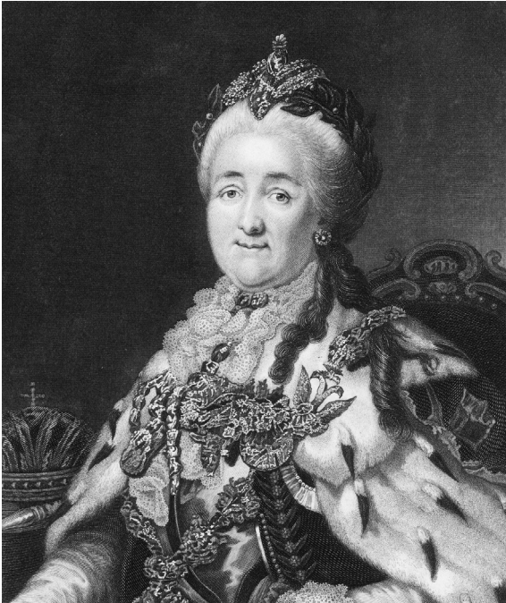
Abb. 1: Katharina die Große, «Zarin aller Reußen», Stahlstich nach einem zeitgenössischen Gemälde

Obwohl die Zarin diese mehr als großzügige Avance formal an alle immigrationswilligen Ausländer adressierte – «krome shidow», mit Ausnahme der Juden, wie der zeitgeistgerechte Vorbehalt hieß –, betrachtete sie als eigentliche Zielgruppe des Manifestes die vom Siebenjährigen Krieg (1756–1763) schwer in Mitleidenschaft gezogene deutsche Bevölkerung. Um aus dem armen Land möglichst viele arbeitsfähige, fleißige Bauern und Handwerker herauszulocken, startete sie eine beinahe modern anmutende Umsiedlungskampagne, angeführt von Iwan Smolin, dem russischen Residenten am Reichstag zu Regensburg. Von Ulm bis Hamburg richtete man in zahlreichen deutschen Städten Sammelpunkte ein, von denen aus die angeworbenen Kolonisten in die Häfen Lübeck und Danzig gebracht wurden. Besonders aktiv an der Werbung beteiligt war ein früherer Beamter der Holsteinisch-Gottorper Kanzlei, Iwan (Johannes) Facius, der 1765 in russische Dienste trat und von Katharina als «Kronagent» eingesetzt wurde. Das Manifest der