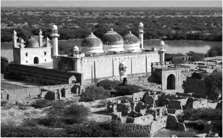
Die Moschee bei Derawar in Cholistan, erbaut 1849

Kohle und Erdgas. An der Makkran-Küste im südlichen Belutschistan begann China 2002 den Bau des Tiefseehafens Gwadar, über den nicht nur China, sondern auch Zentralasien mit der Golfregion ökonomisch verbunden werden soll. Die Wüsten östlich des Indus sind administrativ entweder dem Punjab oder dem Sindh zuzuordnen. Die nördliche Wüstenregion Cholistan gehörte einst zu den Fürstentümern Bahawalpur und Khairpur. Unter den südlichen Ausläufern der Tharwüste im Sindh befindet sich eines der größten Kohlevorkommen der Welt.