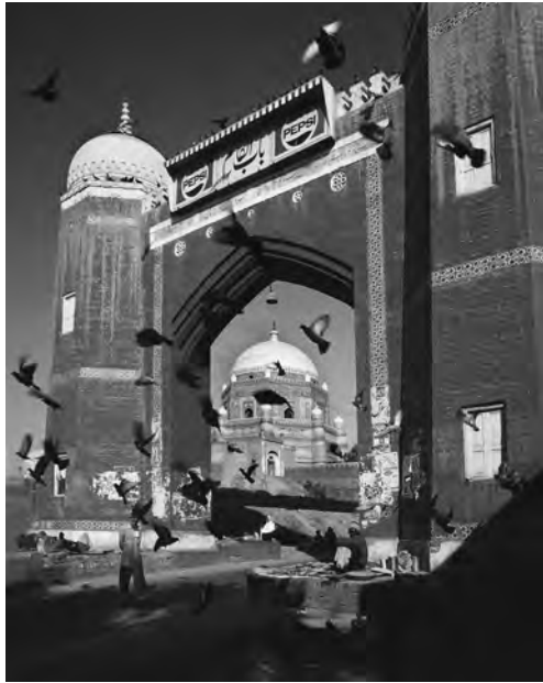
Das Tor von Multan in der Provinz Punjab