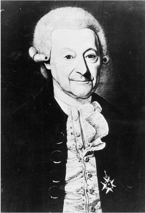
Johann David Michaelis, um 1780

auf die mosaischen Gesetze bezog. Michaelis hat eine Lebensbeschreibung verfasst, in der er ein wenig akademische und gesellschaftliche Rechenschaft ablegte sowie seinen Nachruhm absicherte. Er galt als eitel, als geltungsbewusst. So ging er gerne gestieft und gespornt in die Vorlesung, «den Degen an der Seite, die Bibel unterm Arm». Seine Vorlesungen aber waren höchst unterhaltsam, in freier, fließender Rede gehalten und gelegentlich mit deftigen Zoten gewürzt. Georg Christoph Lichtenberg, auch ein Göttinger Unikat, mokierte sich über Michaelis' Lust an der Selbstdarstellung und über sein professorales Gehabe. Und dann sein Geiz, über den man in der Stadt klatschte! In seinem der großen Welt geöffneten Haus gebe es dürftig zu essen, so hieß es. Er befließige sich einer «Ängstlichkeit im Erwerben», zum Beispiel bei Buchhändlern, zähle gerne die Louisdor und gebe keinem Straßenbettler auch nur einen Heller. Das tat er wirklich nicht, weil er