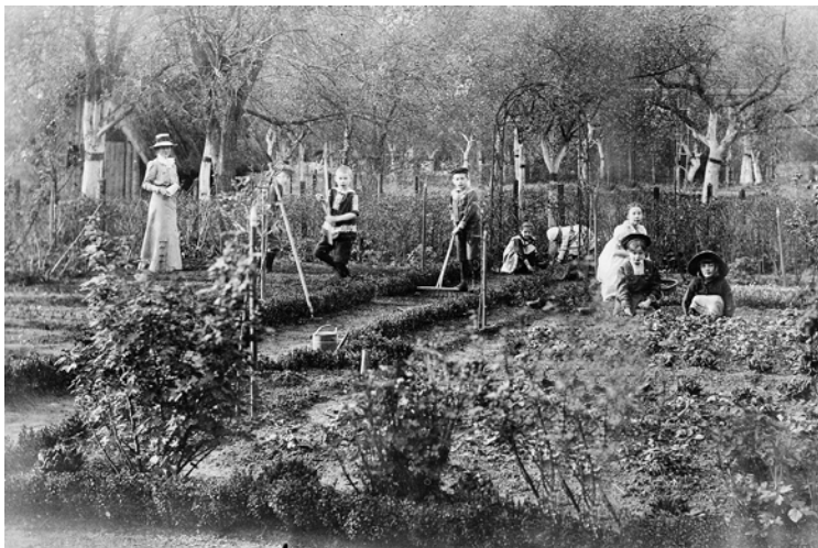
Abbildung 15: Die Yorck'schen Kinder bei der Gartenarbeit – jedes Kind hatte ein eigenes Beet zu bearbeiten.

sie in der Hierarchie eines großen land- und forstwirtschaftlichen Betriebes einnahmen.