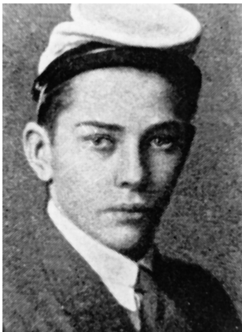
Abbildung 18: Peter Yorck als Korpsstudent in Bonn, um 1923.