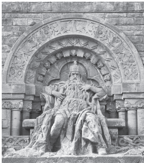
ABB. 4 Das «Kaiser-Wilhelm-Nationaldenkmal» auf dem Kyffhäuser. Eine sechs Meter hohe Sandsteinfigur zeigt den schlafenden Barbarossa, wie ihn Rückerts Gedicht beschreibt. Sie wird von einem Turm überragt, dem ein elf Meter hohes Reiterdenkmal Wilhelms I. vorgelagert ist.

Friedrichs I. [...] Die Siege Kaiser Friedrichs haben das deutsche Volk sich seine Wehrhaftigkeit und Kriegstüchtigkeit wiederum bewußt werden lassen, sie haben es wieder gelehrt in seiner nationalen Kraft anderen Nationen gegenüber sich zu fühlen.» 8 Auch Wilhelm von Giesebrecht (1814–1889), Professor der Geschichte erst in Königsberg, dann in München, zudem Autor einer sechsbändigen Geschichte der deutschen Kaiserzeit, die größten Einfluß auf das Geschichtsbild des deutschen Bildungsbürgertums hatte, betonte die Bedeutung des Staufers «für unsere nationale Entwicklung». 9 Vergleichbare Einschätzungen sind Legion. Natürlich erkannten die Historiker die Andersartigkeit des Mittelalters, sie stellten sie aber «trotzdem mutig in Dienst für eine historisch-politische Entwicklung, die zielstrebig auf die eigene Gegenwart zulief und an einer erhofften Zukunft mitbaute», 10 indem sie sie den entwicklungsgeschichtlichen Zwangsläufigkeiten einer Modernisierungsgeschichte unterwarfen – gerade so,