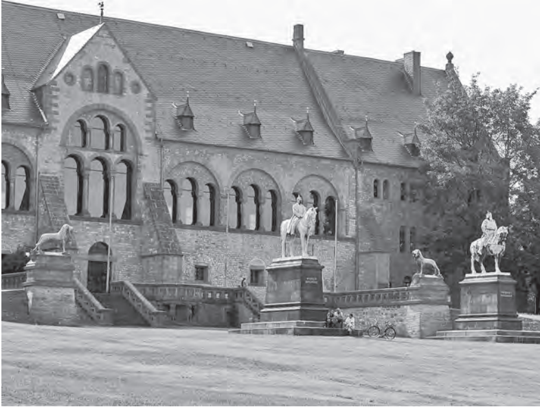
ABB. 2 Die 1900/01 errichteten Reiterdenkmale für Wilhelm I. und Barbarossa vor der Goslarer Kaiserpfalz.

helms I. saß am Sockel auf seinem Thron der erwachende Barbarossa, der Staufer und der Hohenzoller erscheinen als Repräsentanten einer das versunkene und das neue Reich überspannenden, personalisierten Reichsidee – ein Zusammenhang, den auch Wilhelm II. in seiner Festrede vor den versammelten deutschen Fürsten und 30 000 Kriegsveteranen herstellte: «Noch heute wird das deutsche Gemüt mächtig ergriffen von der glanzvollen Herrlichkeit des Hohenstaufferreiches.» Die Einweihung des Denkmals hatte der Kaiser im fünfundzwanzigsten Jahr der Reichsgründung mit Bedacht auf den 18. Juni 1896 gelegt: An diesem Tag war 1815 Napoleon in der Schlacht von Waterloo besiegt worden, an diesem Tag war 1871 Wilhelm I. nach dem Sieg über Frankreich in Berlin eingezogen.