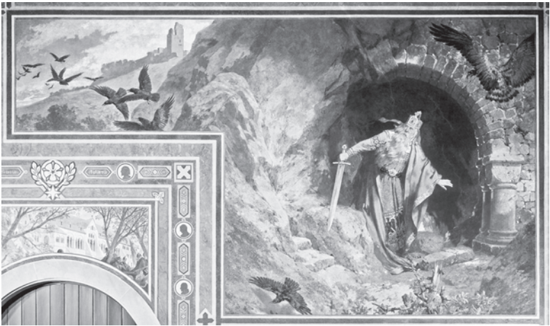
ABB. 3 Auch Barbarossas Erwachen gehört zu den Wandbildern des Goslarer Kaisersaals. Die Blickrichtung des Staufers geht zum zentralen Bild in der Saalmitte, das Wilhelm I., umgeben von seinen mittelalterlichen Amtsvorgängern, als Vollender des Kaisertums zeigt.

hoffte Triumph der verspäteten Nation in Europa gingen eine politisch aggressive Verbindung ein, für die der Name des Stauferkaisers geradezu Symbolcharakter gewann. Daß der Angriffskrieg gegen die Sowjetunion im Juni 1941 als «Unternehmen Barbarossa» geplant wurde, wäre nicht möglich gewesen ohne die fragwürdige Karriere des Staufers als Symbolgestalt nationaler Wiedergeburt und, damit untrennbar verbunden, als mittelalterliche Projektionsfläche für die machtpolitischen Ambitionen des Reichs in der Gegenwart. Der spezifische Beitrag der Historiker zu diesem Geschichtsbild bestand in der Monumentalisierung des Kaisers im Zeichen der Macht. In diesem Sinne schrieb schon Hans Prutz, Professor der Geschichte in Königsberg (1843–1929), im 1874 erschienenen, dritten und letzten Teilband seiner Biographie, der überhaupt ersten wissenschaftlichen Gesamtdarstellung Friedrich Barbarossas: «Von unseren Tagen des neuen deutschen Kaiserthums abgesehen hat sich das deutsche Volk niemals so als Nation gefühlt, ist es niemals von einem so lebendigen, so wirksamen Nationalgefühle, von einem so freudigen und so durchaus berechtigten Nationalstolze erfüllt gewesen als in den Tagen