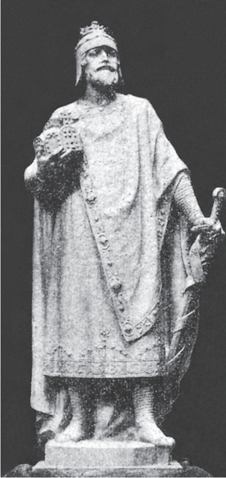
ABB. I An der Außenfassade des Saalbaus in der 1910 fertiggestellten Kaiserresidenz in Posen wurden Statuen Karls des Großen und Friedrich Barbarossas angebracht. Dem Karolinger ließ Kaiser Wilhelm II. seine eigenen Gesichtszüge geben, dem Staufer die seines Vaters, des 1888 verstorbenen Kaisers Friedrich III.

von 1870/71, der in die Gründung des Deutschen Reichs und die Proklamation seines Großvaters, des preußischen Königs Wilhelm I., zum Deutschen Kaiser in Versailles mündete. Bei dem «Prachtwerk», in dem der kleine Wilhelm blättern durfte, handelte es sich um die unerhört aufwendig gestaltete und mit 220 Talern auch unerhört teure zweibändige Edition «Die Kleinodien des Heiligen Römischen Reichs Deutscher Nation», die der Aachener Kanoniker Franz Bock 1864 dem österreichischen Kaiser Franz Joseph I. widmete. 4 Dieses