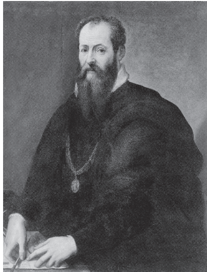
Abb. 1: Giorgio Vasari, Selbstporträt, um 1565, Florenz, Uffizien

als eigengesetzlicher, in sich geschlossener Epoche und als Beginn der Neuzeit ins Wanken bringen, auf Kontinuitäten mit dem Mittelalter verweisen und innere Brüche und Widersprüche herausarbeiten.