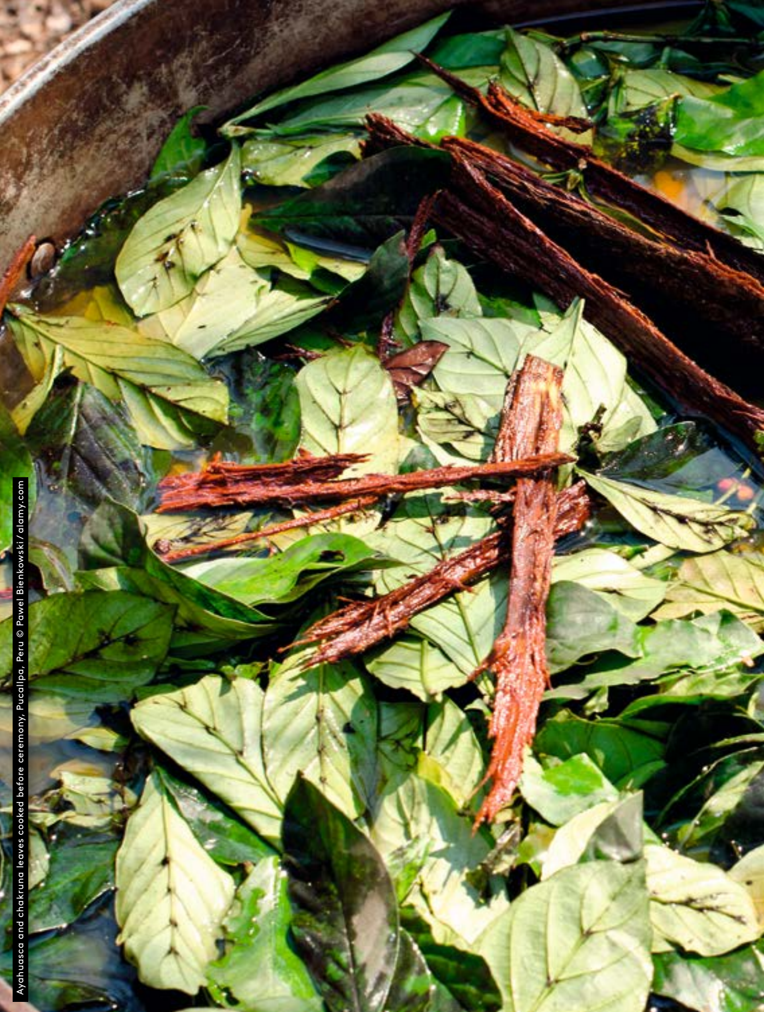
Ayahuasca and chakruna leaves cooked before ceremony, Pucallpa, Peru